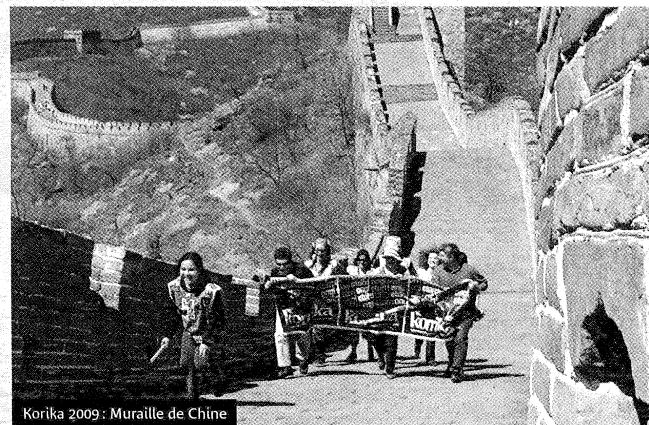
Korika 2009 : Muraille de Chine