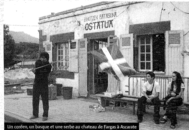
Un coréen, un basque et une serbe au chateau de Fargas à Ascarate