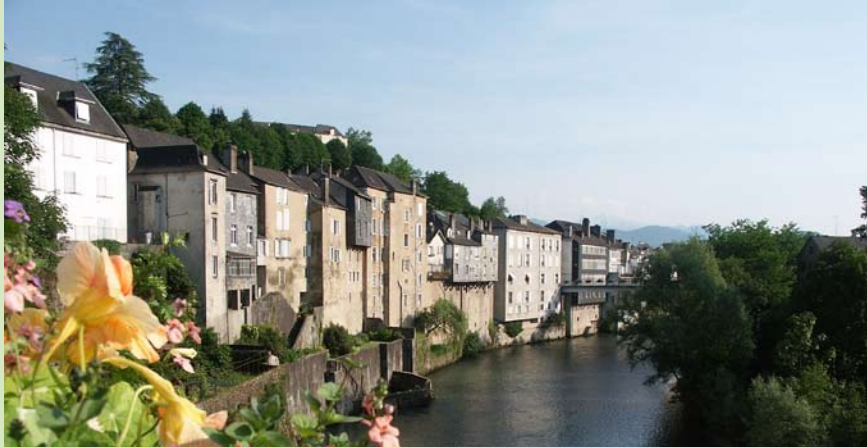
Le gave d'Oloron.

L'ancienne commanderie veillait à la sécurité des Pèlerins de Compostelle sur la voie d'Arles. Le bois du Laring que traverse le GR 653® n'est plus infesté ni de loups, ni de brigands. A partir des hauteurs d'Estialescq, la chaîne pyrénéenne s'impose par temps clair.